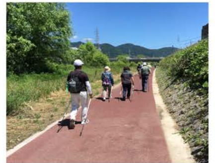
裾花川沿いでウォーキング

ノルディックウォーキングは仲間と一緒に会話をしながら楽しめるスポーツでもあります。より多くの方に体験してほしいと思います。