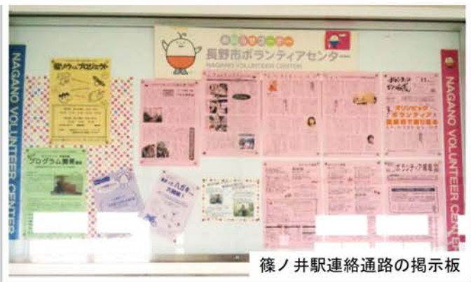
篠ノ井駅連絡通路の掲示板

毎月第2・4日曜日に、篠ノ井駅連絡通路・シューマート稲里店の掲示板のチラシの貼り替えをします。