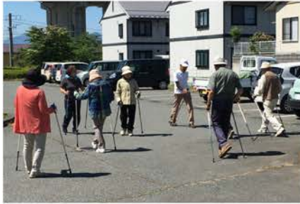
まずはポールの使い方の練習

安茂里地区では地区住民の健康増進を目的としてノルディックウォーキングを推進しており、住民自治協議会の健康福祉部会が中心となり講習会を開催しています。