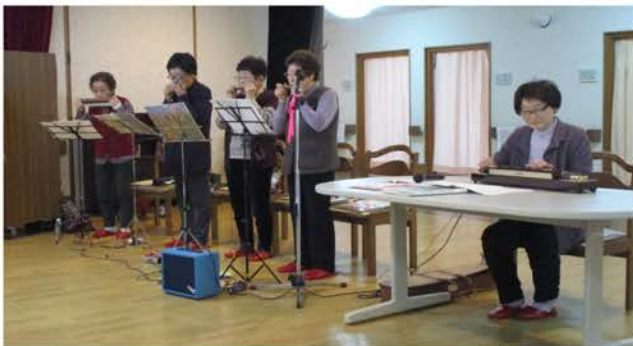
すてきな音色に合わせてみんなで大合唱

へは15年間、ほぼ毎月訪問しています。また、「ニチイケアセンターまめじま」へも約5年間、