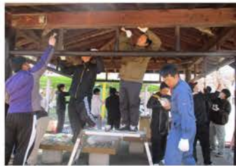
「塗り残していないかな？」と 声掛けあって丁寧な作業

1月下旬、ボランティアセンターに ㈱トーエネック労働組合員の方から 「組合員で何かボランティアを…」と 相談がありました。ボランティア活動を したことがある人もいれば、初めて の人もいます。何がいいか考えていた ところ、動物園を取り上げた広報誌を 目にし、子どもを連れてよく出掛け