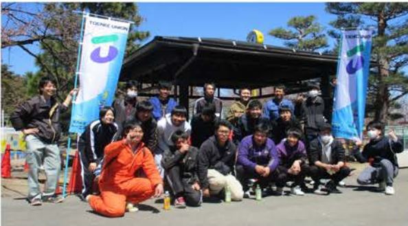
さすがは仕事人！ 時間内でキッチリの仕上がり

ていた城山動物園を思いつきました。 早速、ボランティア受け入れを城 山動物園にお願いしました。 「入園無料だからこそ、市民の皆さ んとメルヘンチックで明るい動物園を 目指したいんです」と園長自ら先頭 を切り、職員も一丸となって、日々奮 闘している最中でした。 「きつと新鮮な視点を得ることがで きますね」と、「東屋のペンキ塗りボ ランティア」の話がまとまりました。 当日、20名ほどの参加がありました。 作業中に話を伺うと「ペンキ塗りのボ ランティアなんて初めてだし、聞いた ときは驚いたけど楽しい！」と答えて くれました。時々 冗談も飛び交いな がらも真剣に、隅 から隅まで丁寧に 作業を行っていま した。普段は話す ことのない人と話 すきっかけにもな り交流の機会にも なったようです。 きれいななった 東屋に、昔の宮 造りの真似をし