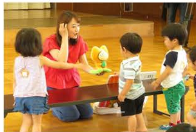
子どもたちも楽しくアナウンサーのお姉さんたちとふれあっています

子どもと親の遊びの広場「アップルキッズ」は浅川地区社会福祉協議会が開催している未就園児と保護者の方を対象とした「子育て子育て支援事業」です。「アップルキッズ」の