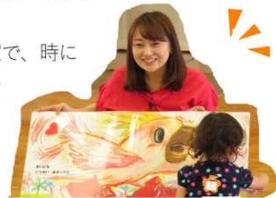
アナウンサーによる朗読

広い会場の大会議室で、時には思い切り走り回る子どもたちとボランティア・役員が一体とり楽しんでいる第3木曜日になっています。