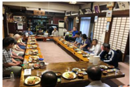
一泊二日の旅行 今日の御馳走は？

長野市保健所開設の際「精神保健福祉ボランティア」養成講座の修了者で集まって、活動を始めました。障がいのあるみなさんとの交流を通じて偏見や差別のない、その人らしい生き方を実現することを目的としています。