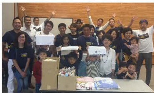
作業を終わって充実した様子のお子さん

もはつきりと見えてきました。まず、マツイ棒と雑巾については、割箸といらなくなったタオル類の回収を全社員に呼びかけました。フードバンクについても、自宅で余っている食