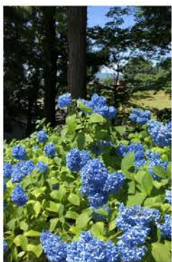
高源院のあじさい

ホワイト(純粋)ナッツ(1本のつるを引っ張れば不揃いの豆でもつながっている)。その名のとおり、純粋で、様々な立場の人がつながっていけるように、活動を続けています。