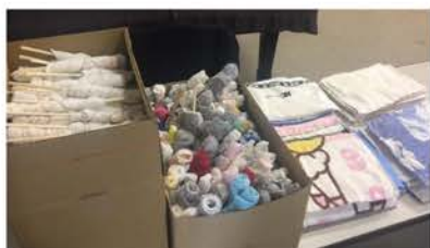
でき上がったマツイ棒と雑巾

いろいろな企業がボランティアをしたいが何をしたらいいかと相談に来ます。今、社会で何が求められているのか、企業としての強みをどう生かせるのか・・・今回はそんな企業の相談の一つをご紹介します。