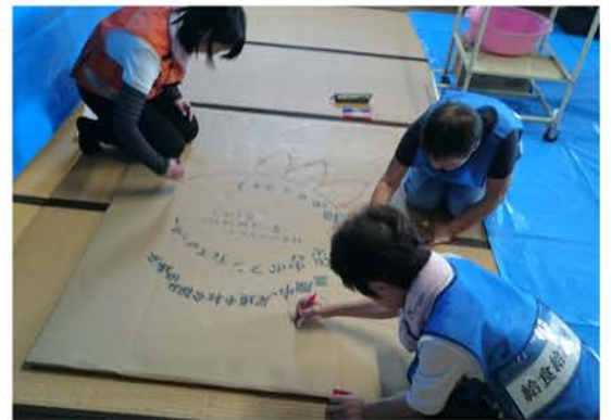
◆みんなで看板作り（三原市）

『呉市天応地区は家の周りに1mほど堆積した土砂を住民やボランティアが汗だくになって撤去している。泥出しは暑さと埃で大変だった。現地ではボランティアが必要。遠いけれどぜひボランティアに行つて欲しい。行けない人は募金を。』と報告がありました。