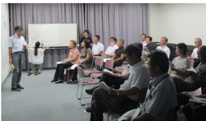
◆報告会には40人が集まった

7月22日～24日、長野県社会福祉協議会ではボランティアバスを実施、30人が参加。猛暑の中、岡山県倉敷市真備町へ片道10時間か