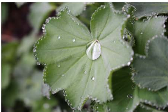
アルケミラモリスの葉に輝く水玉のネックレス

回数が比較的多かったせいか、また自分で好きだったせいか、葉っぱのしずくを見るといつも一連のストーリーが浮かんできます。…バケツから飛び出した「しずく」が、お日様に照らされて水蒸気になって空へ、雲になって、やがて雨になり、また地上へ。まだまだ姿を変えて冒険の旅は続きます。でも結局はまたしずくになって……。目の前の葉っぱのしずくも、陽のぼるにつれ消えていくのでしょうか、見えなくなっただけで、どこかに形を変えて存在するのだなあと妙に感慨深くなるのです。 (徳永 淳子)