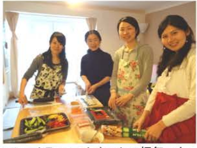
チャリティーイベントの様子