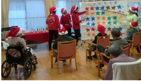
星の楽譜を見ながらみんなで演奏

クリスマスマスの時期でしたので、キーボードとハンドベルを使ってキラキラ星、赤鼻のトナカイなどのクリスマスソングを演奏。キーボードの柔らかな音色とハンドベルの神秘的な響きが、心地よくクリスマススムードを高めてくれます。施設の皆さんに色違いのハンドベルを渡し、初めての方でもわかりやすいよう、音符代わりに星を使った楽譜を見ながら、指揮に合わせて各自担当の星の色のベルを鳴らします。パートごとに数回練習し、みんなで合わせてみる、見事に演奏することができました。すると参加者のみなさ