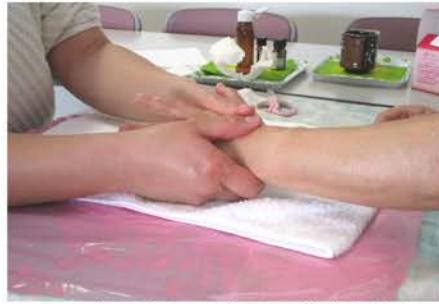
ハーブの香りで身も心も癒されます

行った先々でもボランティアを続けてきたAさんは「ボランティアで色んな人と出会い、短い期間でも濃い付き合いができたから今でも繋がっている人が多い」と振り返りました。