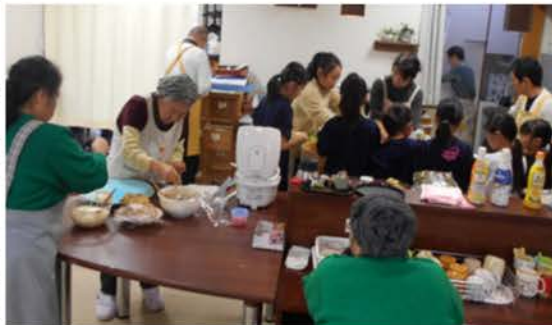
柳町カフェ（子ども食堂）オープン!! みんなで作って・食べて 楽しんでいます

「おかえり」の声掛けに、「ただいま」の子どもの明るい声。そして「ハイタッチ」「楽しい！」「嬉しい！」とおじいちゃん・おばあちゃんは大騒ぎです。そのうちに、センターで宿題をする子どもが集まり、子ども達とふれあう楽しい時間にワクワクしています。