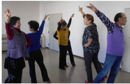
ハッピーダンスの様子

高齢者施設などで、一緒に体操をして汗をかいた後、おしゃべりをしてるのが楽しみです。