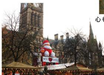
旧市庁舎に飾られたサンタクロース

一方、クリスマス当日は、公共交通は全て止まり、店も開かず、静かで厳かな雰囲気です。日本の元旦のように各家庭で過ごすのが基本です。子どもたちは、朝起きて一番にクリスマスツリーの下に集まり、プレゼントを開けるのが楽しみですよ。