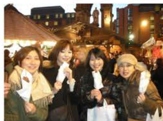
心も体も温まるクリスマスマーケット

次に、花火といえば日本は夏ですが、イギリスの夏は午後10時頃まで明るいので、初冬のイベントになります。ガイ・フォークス・ナイトといって、時の国王の暗殺が未遂に終わったことを記念して始まった行事があり、広い公園で大きな焚き火をし、花火が上がります。移動遊園地もやって来て、真っ暗闇の中で子ども達や若者が電飾のついたメリーゴーランドに乗るといった、暗い寒い冬になんとも不思議な