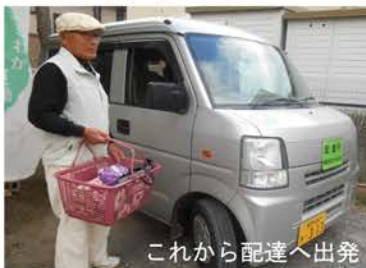
これから配達へ出発

お弁当の配達だけではなく、見守りの役割も担っています。お宅へ何度訪ねても返事がない