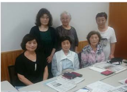
火曜英語のみなさん