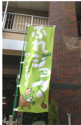
活動先に上り旗が掛かっています

門ではないので、最初は緊張と戸惑いを感じていたようですが、「送迎中の会話が楽しい」「孫ができたみたい」と子どもの成長と一緒に喜んでいきます。ジョブサポーターは学生からシニアまでどなたでもでき、只今ジョブサポーターさん絶賛募集中です！