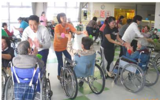
車いすレクダンスの様子

平成17年にスペシャルオリンピックスが長野市で開催されたのをきっかけに、現在の活動が始まりました。主として、長野車いすマラソンではコーナーを安全に曲がるためスポンジを持って立つたり、フロアホッケー大会の運営に関わり開会式・表彰式などを担当しています。また、介助が必要な高齢者・身体に障がいのある方・日常生活の動きに規制がある方々が健常者