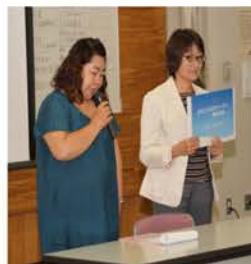
公開審査会にて 事業説明 ←