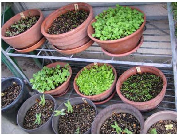
春を待つ花の苗たち