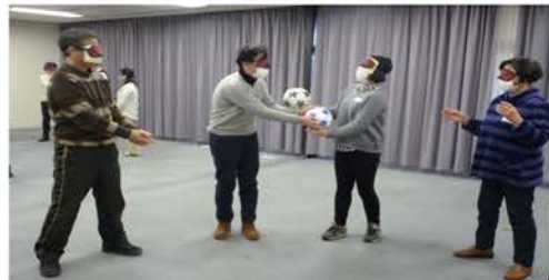
視覚に頼らずボールの受け渡し

「僕は障がい者だけど、だからなに? プロレスがしたい! リングに立ちたい!」 福祉とは「みんな一緒に楽しむことでお互いが笑顔でいられること」