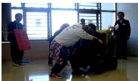
障がい者プロレス

人は人と生きてこそ「人」 ひきこもりは、社会とのつながりがなくなった時がいちばんこわい! 高齢者・障がい者・児童福祉、全てを一つの「福祉」と捉え、もっと身近に感じていただけるお手伝いがしたい。