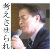
「誰もが自分の人生において主人公。」まさにそれをあらためて考えさせられる研修の場でした。

講師の方々の日々の実践に裏づけされた言葉の重さに心を動かされた参加者たち。そして、その参加してくれた人たちが誰かに言われたからやるのではなく、自分ごととして周りの人ともつながり、愛すべき主人公と成りたいものです。