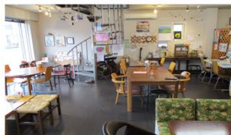
ごちゃまぜカフェへようこそ