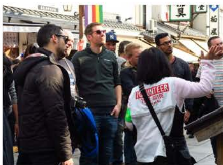
善光寺の説明をするメンバー

今後も外国人観光客のために、さらにガイド力を磨き、長野の魅力をとくさん伝えていきたいと思っています。