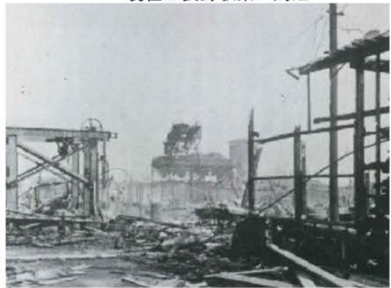
破壊された旧国鉄機関区の洗濯場 現在の長野駅東口周辺

毎年8月13日に行っている「長野空襲を語る集い」には力を入れており今年で33回を迎えます。