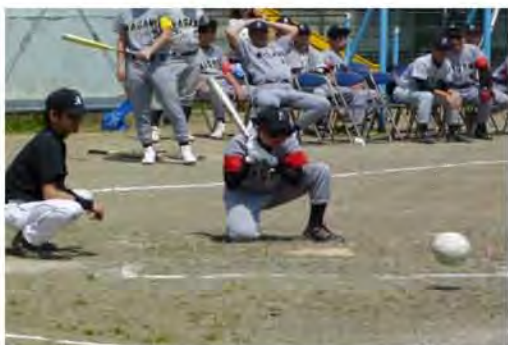
跳ねながら転がってきたボールとかまえるバッター。今だっ! 打ってえ〜!

ランナーコーチャーと一緒に塁に立つ バッターもすごいよ。ボールが地面を転がる音でバットを振るんだ。速い球や遅い球もあるのに、みんなよく打つんだ。ボールを打ったら走るでしょ。