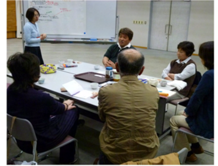
語りだすと、止まらないメンバー。熱い気持ちは活動している人ならではの

伊 .. コミュニケーションのツールとして手や足が出る子はいらっしゃいますか？ 氷 .. 甘えの逆というか、ここまでは手を出してもいいのかなど。それが受け入れられると、かえって甘えてしまう。