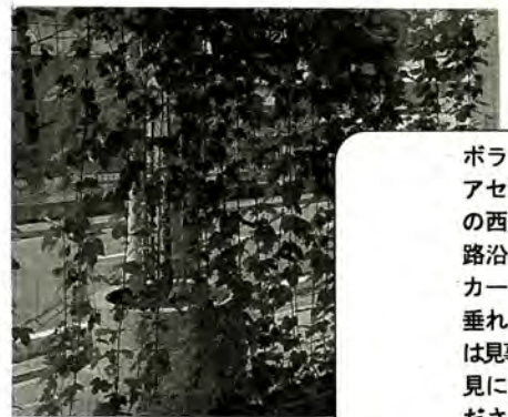
ボランティアセンターの西側の道路沿いに、カーテンが垂れてそれは見事です。見に来てください!

飯綱高原、大座法師池の奥に位置する「小天狗の森」。木々に40種類ものネームプレートがつけられています。ここには、子供たちに興味をもってもらうための工夫が。プレートは数枚が重なっており、まず始めには「Who are you?」。一枚めくると葉の形、もう一枚めくると花の形、そして最後にその木の名前が書いてあるのです。昨年、「飯綱高原に自然の花を咲かす会」の方たちが市内の小中学生とともに作ったのですが、15年前、別荘地や畑に開拓されて減りつつある自然の花を