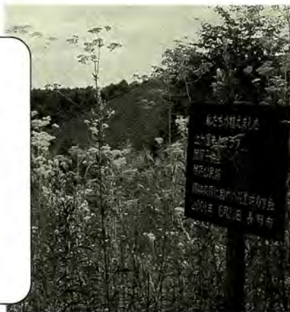
アゼリア入り口広場に植栽