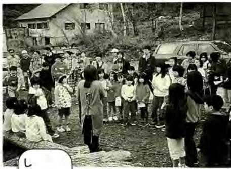
しいたけのこまうちの説明