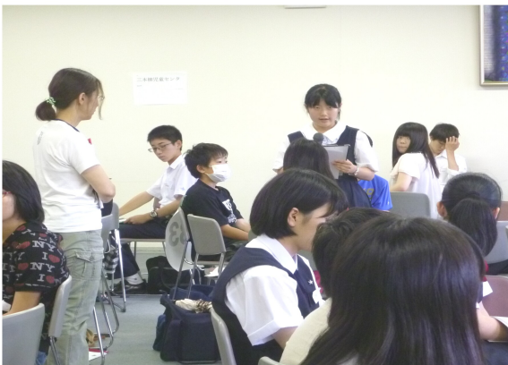
目標を自信持って発表している姿は素晴らしい！