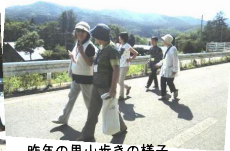
昨年の里山歩きの様子

『大岡にこんないいところがあったことを知らなかった』という意見がだされました。2回目の講座には、大岡中学生も参加し学