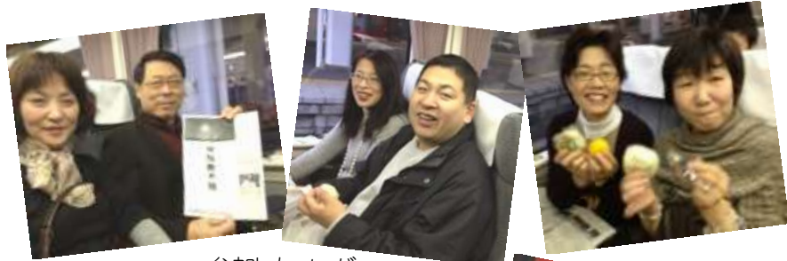
参加したメンバー

まちの縁側を推進するためにも、延藤先生の最終講義を聞いて学ぼうということで、参加したプロジェクトのメンバー。意気込んで、いざ岡崎へ！会場の最寄り駅藤川までは、3 回乗り換え、右往左往しながらも、現地までの約4時間、ほとんどしゃべりっぱなし。まさかの車内ミーティングでした。そんな様子を『やじきた縁遊記』として、ちょこつとご紹介します。