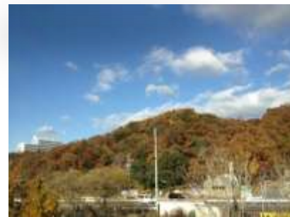
おやおや?景色はまるで長野のよう・・・丘の上に愛知産業大学が見えました。