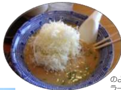
キャベツの千切りが山のように盛られたラーメンで腹ごしらえ